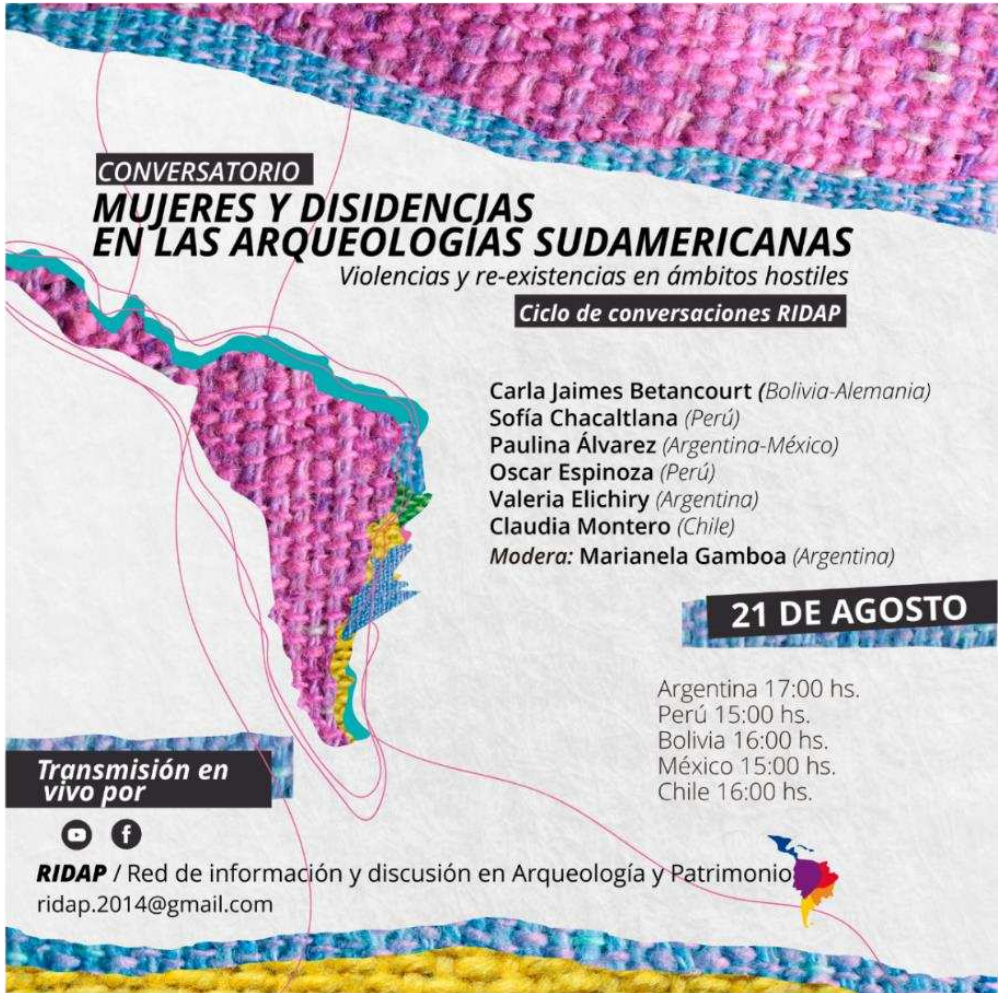
Figura 1. Flyer del Conversatorio Mujeres y Disidencias en las Arqueologías Sudamericanas, organizado por la Colectiva Feminista RIDAP. Diseño Marianela Gamboa y Juani de la Vega. Figura en color en la versión digital.

prácticas naturalizadas, como la de evadir el tratamiento de los temas relacionados al acoso sexual y otros tipos de violencias cotidianas en las redes académicas y profesionales. De estas reuniones surgieron acciones públicas, entre ellas el Conversatorio “Mujeres y Disidencias en las Arqueologías Sudamericanas. Violencias y re-existencias en ámbitos hostiles” 9 (Figura 1), y posteriormente la Serie Podcast con tres capítulos con el mismo nombre 10 (Figura 2).