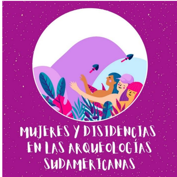
Figura 2. Diseño de portada Serie Podcast “Mujeres y Disidencias en las Arqueologías Sudamericanas”. Trabajo realizado por la Colectiva Feminista RIDAP, con la participación de las Colectivas GEFAS, WILKAS y FLAMA, y el trabajo de edición de Paula “Peperina” Garcés y Maximiliano Reta. Diseño de gráfica Juani de la Vega. Figura en color en la versión digital.

Durante este tiempo la Colectiva Feminista de la RIDAP participó de reuniones mensuales de una red feminista transfronteriza más amplia, que fue integrando diferentes colectivas, mujeres y disidencias (estudiantes, graduadas, docentes e investigadoras) de Argentina, Bolivia, Chile, Colombia, Ecuador y Perú, muchas de las cuales participan del presente Dossier . En la segunda parte de este trabajo deseamos compartir las reflexiones, sentires y emociones que nos ayudaron a transitar colectivamente el aislamiento social en épocas de pandemia, posibilitando también el encuentro entre mujeres y disidencias sexo-genéricas y no binaries de diferentes puntos del Abya Ayala.