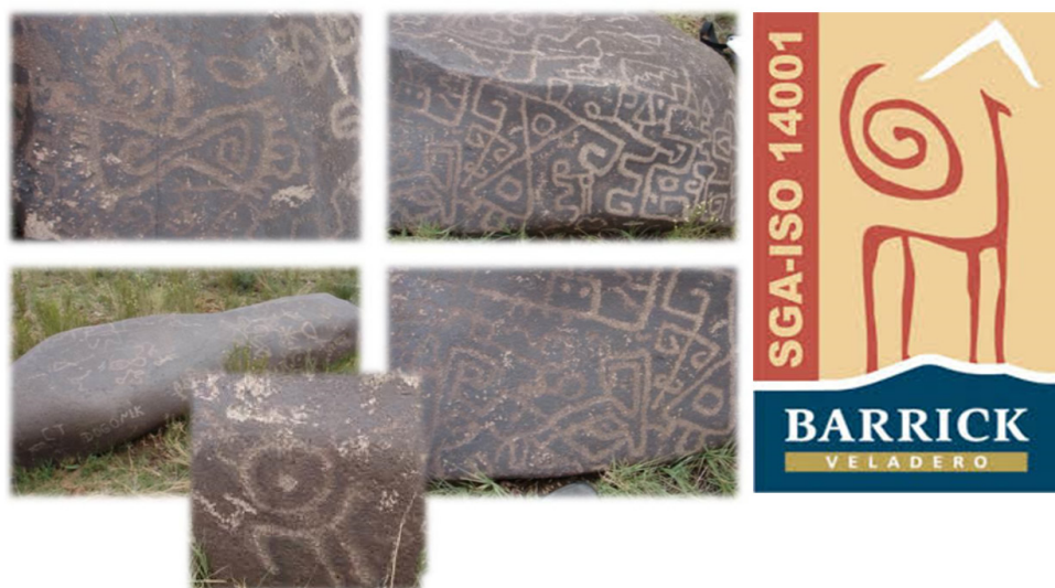
Figura 3. A la izquierda: “Piedra de las Juntas de Colangüil”, roca de siete toneladas grabada en todas sus caras y ubicada en el lugar homónimo, en el derrotero de la leyenda de Osorio (Foto de la autora). Derecha: isologo Mina Veladero, operada por Barrick Gold, utilizando la figura del guanaco con el círculo y punto que señala la ubicación de aguadas –según interpretación local–. El dibujo de la empresa utiliza el mismo símbolo, pero lo modifica con una espiral o caracol.

La presencia de la Secretaría de Minería de la Provincia de San Juan dentro del Comité de Asesores Regionales 140 del Proyecto Qhapac Ñan aclara este punto de la participación empresarial megaminera en el proyecto; hecho que, además, es usado estratégicamente y ocultado cuando se realizan exposiciones de las actividades de promoción educativa del proyecto en informes públicos, especialmente en Argentina, por la resistencia social que el tema provoca.