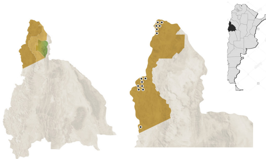
Figura 1. Ubicación de la Reserva de Biosfera y de los catorce proyectos mineros en funcionamiento dentro del área de usos múltiples de la Reserva de Biosfera San Guillermo (MAB-UNESCO).