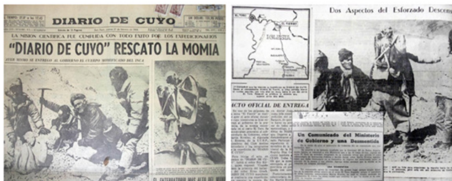
Figura 5. Portada e interior de la edición papel del 27 de febrero de 1964 del Diario de Cuyo de San Juan.

El tratamiento del cuerpo del joven del cerro El Toro, su consumición mediática y científica en la construcción del patrimonio exótico de la provincia , tuvo su contracara en su construcción popular como hito histórico del despojo en los pueblos de Malimán, Colanguil, Anagualasto y Rodeo. Varios de estos relatos sobre las expediciones de la momia del Toro fueron retratados en el documental Hijos de la Montaña del documentalista sanjuanino Mario Bertazzo en 2011 157 realizado en colaboración con el Colectivo Cayana. El documental centra su atención en el pedido de restitución del cuerpo realizado a comienzos del dos mil, por parte de alumnos de la Escuela Albergue de Malimán. Estos enviaron una carta al gobernador Jose Luis Gioja solicitándole el apoyo para el retorno de la momia del Toro a Iglesia. “Señores Diputados, Senadores, Intendentes, Concejales y Gobernador solicitamos en nombre de los niños del Departamento de Iglesias, que las momias y sus culturas regresen al lugar de origen. Nosotros, los chicos y nuestro pueblo se los vamos a agradecer” rezaba el final de la carta (Jofré 2013, p. 263)